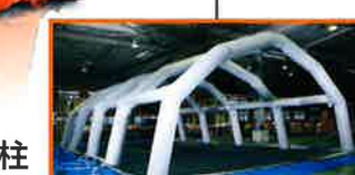
Aシリーズ気柱 ※写真はA-812Sです。