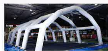
天幕・床、取り外し構造(メンテナンスに不可欠。)

高耐久CSMゴム引布を使用した信頼性の高い気柱。CSMゴムは高温～低温環境下に強く、薬品などの耐性にも優れた素材です。アキレスはこのゴム素材に着目し50年来ゴムポートの素材として使用してきました。そしてエアータント専用設計したCSMゴム引布を独自に開発し気柱に使用しています。