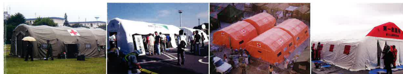
| AKBエア-テントシステム