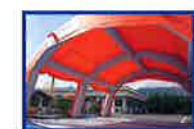
テント内部イメージ。